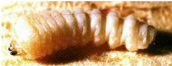
Bild 1 (oben): Larve, ca. 20mm lang. Auf den ersten Blick unterscheidet sie sich nicht sehr von einer Vielzahl andere Insektenlarven, z.B. Engerlingen.

Zunehmendem Alter des Holzes wird daher die Entstehung eines intensiven Befalls unwahrscheinlicher aber nicht ausgeschlossen. Die in der Literatur genannten Zeiträume von 30-60 Jahren, in denen das Holz besonders reizvoll für die Insekten ist, sind zwar durch Erfahrungen belegt, aber auch wesentlich ältere Hölzer können, vor allem nach Umbauten, befallen werden. Dabei scheint vor allem der Geruch des Holzes für das Insekt entscheidend zu sein, um das Material für die Eiablage aufzufinden. Durch Ihre verborgene Tätigkeit und die ca. 6-8mm dicken Gänge (Käfer ca. 20mm lang, Bild 2) und Ausfluglöcher können Holzbauteile völlig zerstört werden. Typisch ist das Stehenbleiben einer papierdünnen Holzoberfläche, die von einzelnen Ausfluglöchern bezeichnet wird (Bild 3). Das Holz unter der Holzschicht ist zu Staub zerfressen. Kernholz wird nicht befallen.