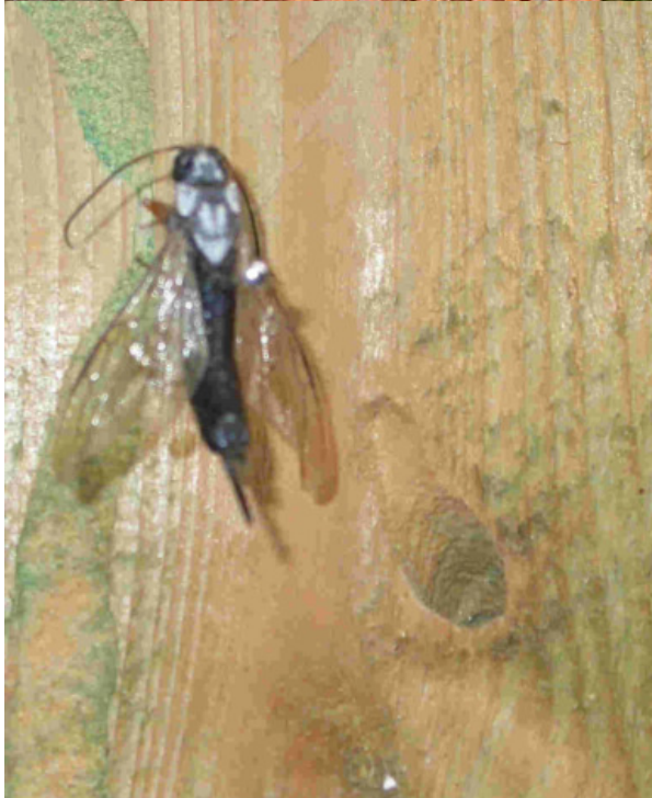
Bild 5 (links): Holzwespe mit rundem Fraßgang (schräg angeschnitten!), die oft so fest verstopft sind, daß sie beim Einschnitt nicht erkannt werden. Hier durch Tauchimprägnierung grün angefärbt.

Bild 4 (oben): Fraßbild des „Holzwurms“. Die Schädigung ist erheblich geringer. Beide Insekten zerstören nur das Splintholz.